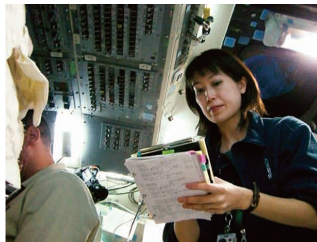
スペースシャトルミッション・シミュレーション訓練を行う山崎直子宇宙飛行士 (NASAジョンソン宇宙センター) Astronaut Naoko Yamazaki takes part in simulation training for the Space Shuttle mission. (Johnson Space Center, NASA)

Previously, most of the JAXA astronauts flew on Space Shuttles missions into space, but when the Space Shuttle program ends in 2010, the only way to travel into space will be on the Russian spaceship Soyuz.