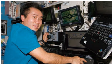
国際宇宙ステーションの米国実験棟「デスティニー」でロボットアームを操作する若田光一宇宙飛行士 Astronaut Koichi Wakata operating the Canadarm2 robotic arm in the U.S. Laboratory Module Destiny in the ISS.

ISSは微小重力、高真空に代表される宇宙環境という特殊な環境を利用し、人間が参画して実験や観測などを恒久的に行うことを目的とした宇宙施設です。およそ40回もの宇宙飛行による組み立てによって完成しました。