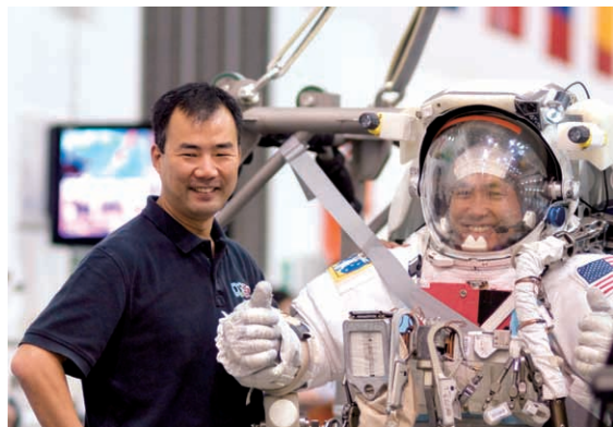
船外活動訓練を行う野口聡一、若田光一宇宙飛行士 (NASA ジョンソン宇宙センター) Astronauts Soichi Noguchi and Koichi Wakata during training for Extravehicular Activities. (Johnson Space Center, Nasa)

これまではJAXA宇宙飛行士は主にスペースシャトルで打ち上げられてきましたが、2010年スペースシャトルの退役後からは、ロシアアノューズ宇宙船が唯一の打ち上げ手段となります。