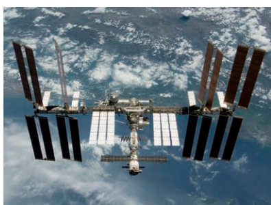
国際宇宙ステーション The International Space Station

ISSの組み立ては1998年11月から開始され、2000年11月から宇宙飛行士が常時滞在をはじめました。それから12年の月日が流れ、2010年にISSは完成を迎える予定です。日本では、若田光一宇宙飛行士が2009年3月から、野口聡一宇宙飛行士が2009年12月からの長期滞在进行しています。今後、ISSの運用が計画されている2020年までに全部で約10回の日本人宇宙飛行士の滞在機会があり、活躍が期待されます。