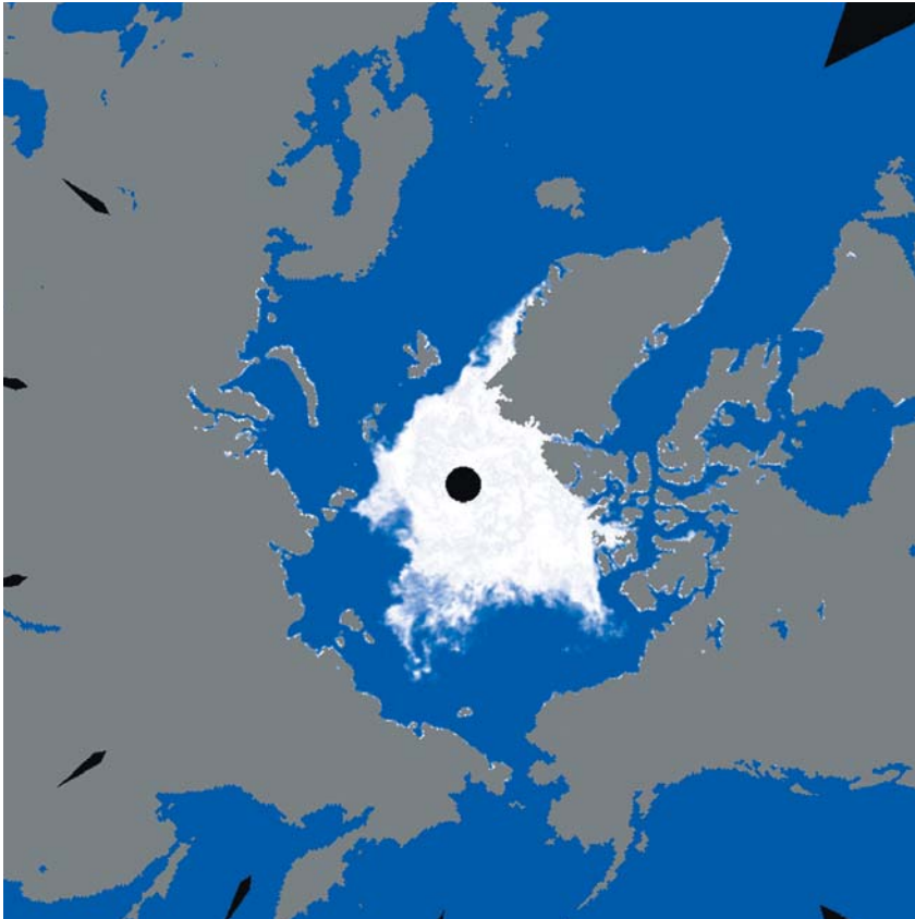
AMSR-Eが捉えた2011年9月9日の北極海水分布

北極海の海水密接度の最新画像および過去に観測された画像は、 北極海海水モニターウェブサイト上で公開しています。 http://www.ijis.iarc.uaf.edu/jp