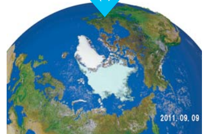
融解最小時期の北極海水分布 (上:1979年 中:2007年 下:2011年) 2011年は、シベリア沿岸からすっかり海水がなくなっており、また、カナダの多島海でも島と島の間に広く水路が開いている様子が分かる

「JAXA's」配送サービスを行っています。ご自宅や職場など、ご指定の場所へJAXA'sを配送します。本サービスご利用には、配送に要する実費をご負担いただくことになります。詳しくは下記ウェブサイトをご覧ください。