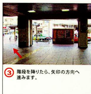
③ 階段を降りたら、矢印の方向へ進みます。