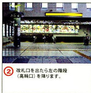
② 改札口を出たら左の階段(高輪口)を降ります。