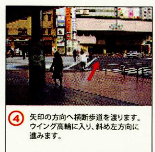
④ 矢印の方向へ横断歩道を渡ります。ウイング高輪に入り、斜め左方向に進みます。