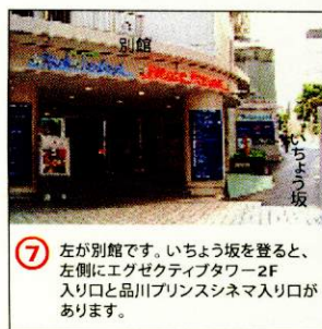
⑦ 左が別館です。いちよう坂を登ると、左側にエグゼクティブタワー2F入り口と品川プリンスシネマ入り口があります。

Shinagawa PRINCE HOTEL 〒108-8611 東京都港区高輪4-10-30 TEL (03) 3440-1111 FAX (03) 3441-7092