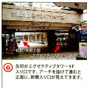
⑥ 矢印がエグゼクティブタワー1F入り口です。アーチを抜けて進むと正面に、新館入り口が見えてきます。