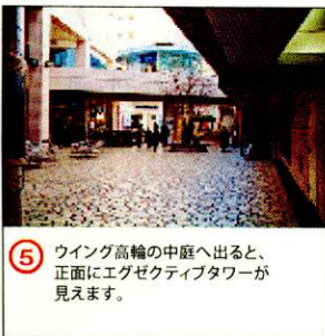
⑤ ウイング高輪の中庭へ出ると、正面にエグゼクティブタワーが見えます。