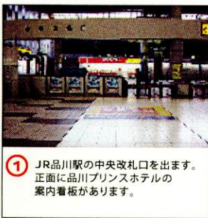
① JR品川駅の中央改札口を出ます。正面に品川プリンスホテルの案内看板があります。

※品川プリンスホテルは、品川駅から徒歩2分とアクセスが大変便利です。 ※駐車場には限りがございますので、電車・バスをご利用ください。 ※時間によりウイング高輪は通行できない場合がございますのでご了承ください。