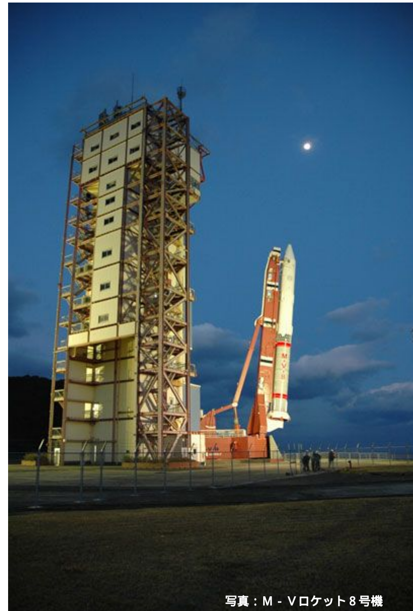
写真：M - Vロケット8号機