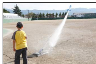
▲水ロケットの実験