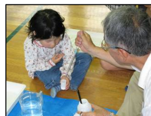
▲プチロケットの実験