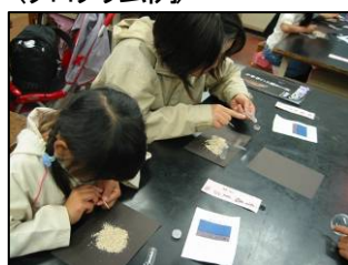
▲星砂で星座絵をかたどる工作