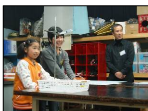
▲アルコールロケットの実験