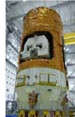
HTV技術実証機 (今回打ち上げた機体)