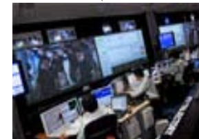
地上運用管制 (筑波宇宙センター)