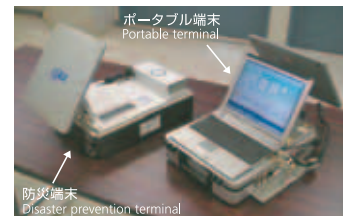
▲ 防災端末・ポータブル端末 Disaster prevention terminal/Portable terminal ▲ 超小型端末 Ultracompact terminal

The KIKU No. 8 will conduct orbital experiments on mobile voice communication and high-speed packet communications with hand-held terminals in the S-band frequency. For these experiments, phased array feeder and beam forming networks have been developed to synthesize signals into several beams to cover the entire nation for improvements in radio wave use efficiency. Onboard processor switches have also been developed, enabling single-hop satellite communication without ground switchboard. JAXA has developed a portable ground terminal for data transmission covering up to 1.5Mbps and a PDA-sized ultra compact mobile terminal. Application experiments have been conducted with the terminal, covering mountains and oceans in the context of disaster prevention.