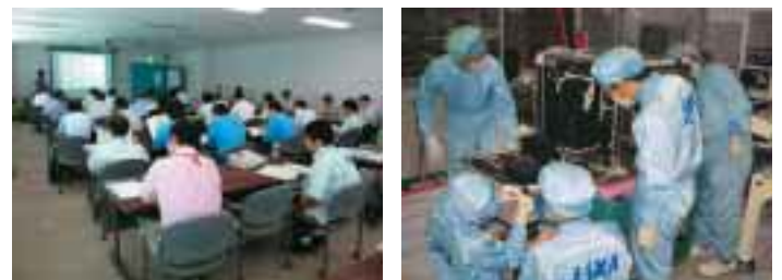
▲ 設計確認会と若手技術者によるフライトシステムの組み立て Design review and in-house integration of flight system by young engineers.

The bus equipments are composed of Small GPS Receiver (GPSR) modified from car navigation system, Small Sun Sensor (MSS) using CMOS APS based COTS, and Advanced monitor Camera (ACMR) developed based on commercial CMOS detectors.