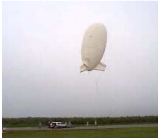
2.5 m船による放船模擬試験 (北海道大樹町多目的航空公園)