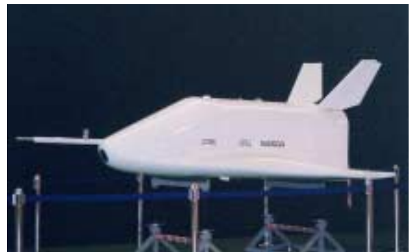
(右図) フェーズ 高速飛行実証機 遷音速領域の空力特性取得試験機 (スウェーデン、エスレンジにて試験予定)