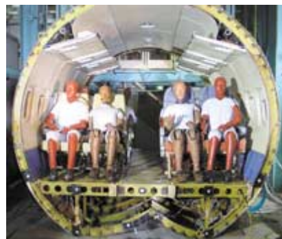
YS-11実機を用いた落下衝撃試験