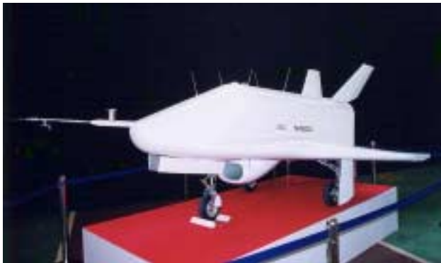
(左図) フェーズ 高速飛行実証機 進入、着陸時の航法技術試験機 (キリバス共和国にて試験予定)

宇宙輸送システムの研究開発に関しては、将来の再使用型宇宙輸送機実現に必要な誘導制御技術・遷音速空力技術を獲得することを目指し、高速飛行実証実験を実施する。平成13年度においては当研究所、宇宙開発事業団及びフランス国立宇宙研究センターの三者間で了解覚書(MOU)を締結し、高速飛行実証実験の事前試験として模擬機体を使ったバルーンの打ち上げ確認試験をスウェーデンのエスレンジにて実施した。また、将来の最適な再使用型宇宙輸送推進システム形態を模索するため推進システムとして有望と思われる、ターボ系エアブリーディング、スクラムジェットエンジン及び再使用ロケットエンジン等推進系技術について、燃焼器、ノズル等の要素技術の研究を行った。