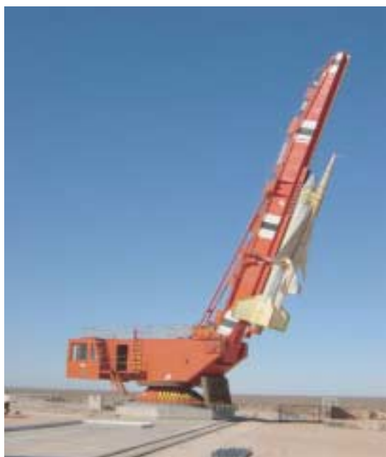
ランチャに搭載されたロケット実験機 （豪州ウーメラ実験場）

次世代超音速機技術の研究開発においては、小型超音速実験機（ロケット実験機及びジェット実験機）の飛行試験を通じて得られるデータ、経験を基に大型計算機を用いた最適な機体形状設計技術の基礎を確立するため、平成13年度においては、ロケット実験機本体及び打ち上げロケットの製作を行い、試験場である豪州ウーメラにおいて飛行試験に係わる地上支援設備の整備を完了させ、実験機とロケットの結合を行ったとともに機能確認試験を開始し、飛行試験に着手した。また、ジェット実験機に関しては、数値流体力学（CFD）を用いた逆問題・最適化設計法を開発し、ロケット実験機の成果を反映しつつ基本設計を行った。併せて、搭載エンジン試験、推進システム設計を行った。