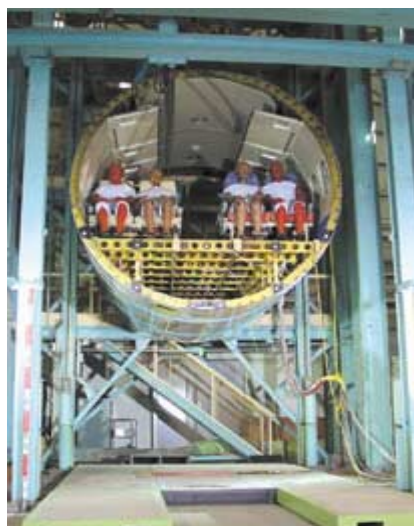
(左図) 落下衝撃試験前

特別研究のうち「航空安全・環境適合性技術の研究」の実施例のひとつとして、YS-11実機の部分胴体を用いた落下衝撃試験が挙げられる。これは、客室部分の胴体構造の衝撃吸収を推定する解析手法と衝撃吸収に有効な構造様式の研究の一環であり、航空機がクラッシュ事故に遭遇したときに搭乗者に伝わる衝撃荷重の軽減により、致命的な衝撃荷重とならないようにすることを研究の目的としている。