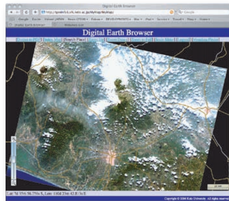
▲ 衛星画像表示画面：ALOS画像＋地図