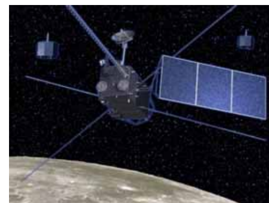
月周回軌道中のコンフィギュレーション