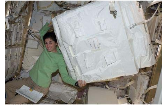
与圧カーゴの搬出作業の様子