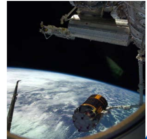
ISSからの離脱の様子