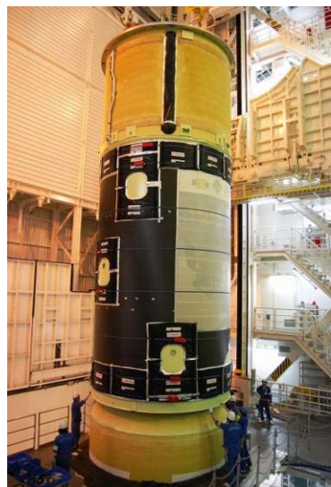
第1段・第2段起立 (H22.4.12 完了)