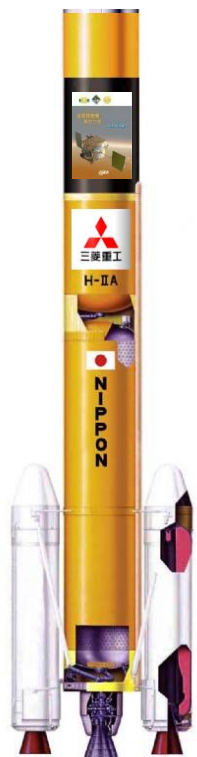
機能点検 (H22.5.3 完了)