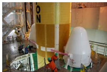
SRB-A結合 (H22.4.16 完了)