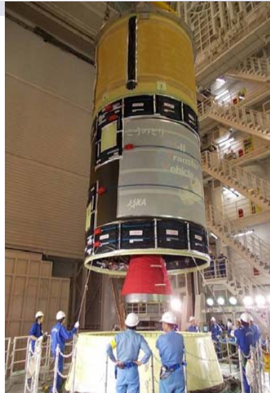
第1段・第2段結合 (H24.3.18完了)