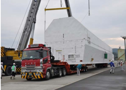
機体島内輸送 (H24.3.17未明完了)