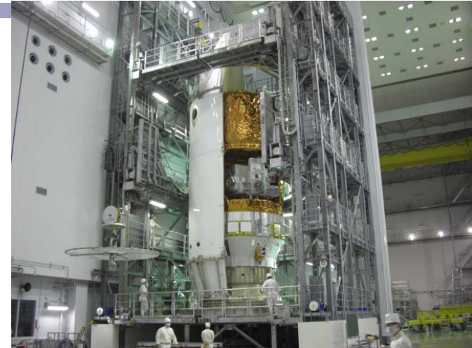
「こうのとりのこ」3号機フェアリング収納 (H24.7.1完了)