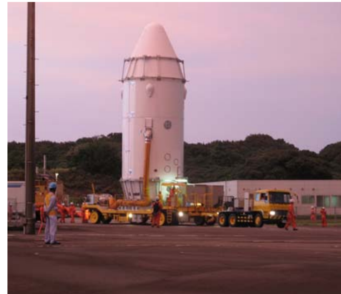
「こうのとりのこ」3号機およびフェアリング 機体結合(H24.7.7~8)