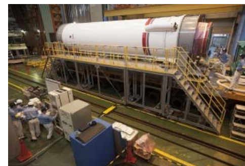
第1段機体の各種点検の様子