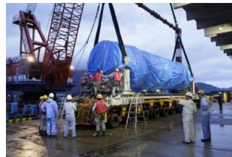
第1段の内之浦港到着