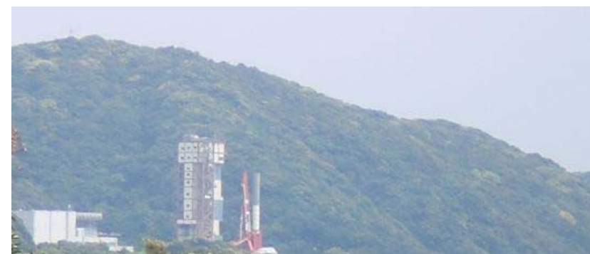
ランチャ巡回試験